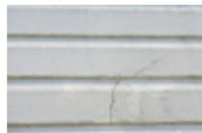
サイディングのひび割れ