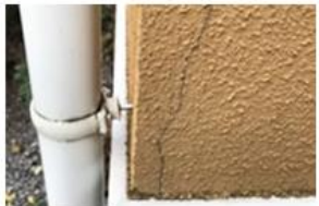
ひび割れ (長い亀裂)