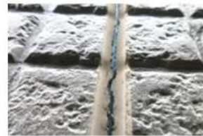
割れて中が見える