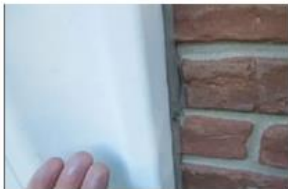
指に粉がつく現象