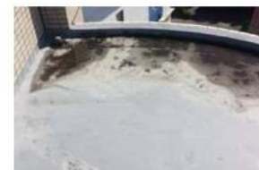
水たまりがひかない