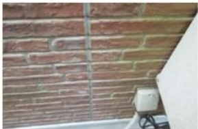
コケ (湿気を帯びている)