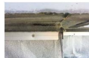
防水端末のシール切れ