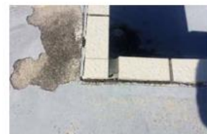
タイル取合部分のシート切れ